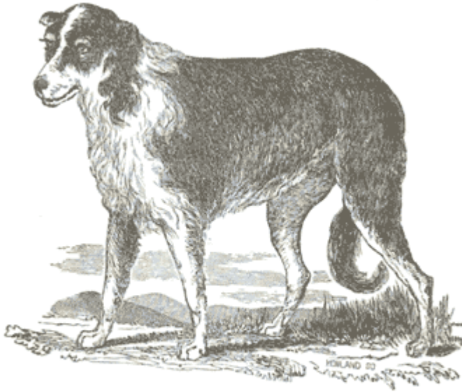
Arrogante, a Spanish sheepdog, from Sheep Husbandry by Henry S. Randall (1856)

I cani che aiutarono a spostare le greggi dal New Mexico erano primariamente di origine Spagnola. Vecchi documenti descrivono i "New Mexican Sheepdogs" come cani da guardia grandi e forti, di aspetto lupino e generalmente di colore bianco-giallastro, con alcune menzioni del colore nero focato.