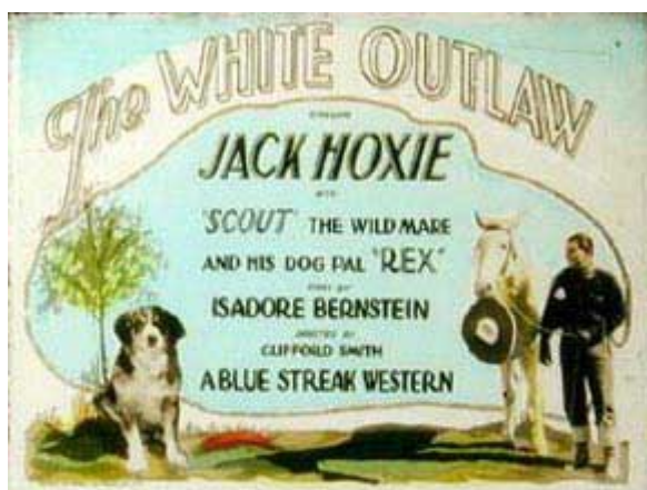
An advertisement for one of the films starring Jack Hoxie and an Australian Shepherd named Bunk. In this 1925 movie, Bunk was billed as "Rex"

Alla fine degli anni '20 e inizio degli anni '30 un Australian Shepherd di nome Bunk apparve in un film con il famoso cowboy Jack Hoxie, e apparve anche in film non western, come la versione del 1928 del film "Shepherd of the Hills" e "Little shepherd of Kingdom Come". Bunk apparve anche assieme ad Hoxie nel 101 Ranch Wild West Show e nel Bownie Bros. Circus. Era blue merle, e di aspetto simile agli Aussie odierni, nonostante la coda lunga.